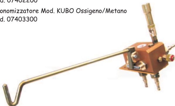
Economizzatore Mod. KUBO Ossigeno/Metano Cod. 07403300