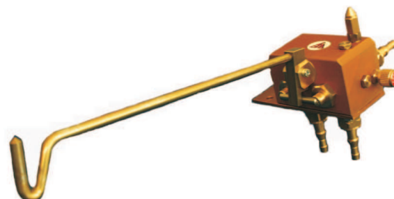
Economizzatore Mod. KUBO Ossigeno/Acetilene Cod. 07402100