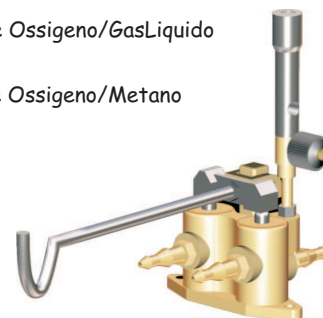
Economizzatore Ossigeno/Metano Cod. 07400300